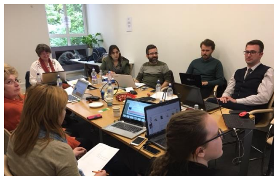
Οι εταίροι σε συνάντηση στο Λονδίνο, τον Μάιο του 2017

Δεξιοτήτων για Ενισχυμένη Διδασκαλία με τη χρήση της τεχνολογίας (ΤΕΤ).