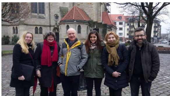
Εταίροι στην συνάντηση στο Αννόβερο, Γερμανία τον Ιανουάριο του 2017

Η πρώτη εναρκτήρια συνάντηση , στην οποία παρευρέθηκαν όλοι οι εταίροι, πραγματοποιήθηκε τον Ιανουάριο του 2017 και φιλοξενήθηκε από τον συντονιστή εταίρο το Πανεπιστήμιο Leibniz στο Αννόβερο της Γερμανίας. Μια αποτελεσματική και έντονη συνάντηση είχε ως αποτέλεσμα τη δημιουργία ενός πολύ σαφούς σχεδίου δράσης με σημεία αναφοράς και προθεσμίες, τα οποία οι εταίροι θεώρησαν πιο χρήσιμα και συναρπαστικά.