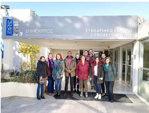
Projekta partneru tikšanās 2018. gada janvārī.

Tikšanās galvenais mērķis bija pārraudzīt projektā notikušo progresu un plānot nākamos soļus, ņemot vērā, ka moduļu izveidei atvēlētais laiks bija gandrīz beidzies. Tika iepļānota arī nākamā projekta sanāksme, kuras laiks tika attiecīgi saskaņots ar projekta gala konferences laiku.