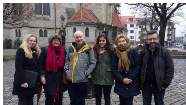
Partneru tikšanās Hannoverē 2017. gada janvārī