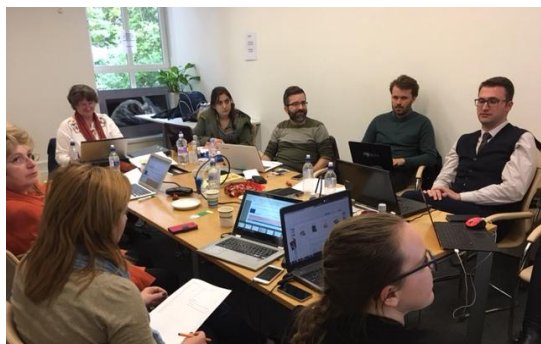
Parteneri la întâlnirea de la Londra din mai 2017

Parteneri la reuniunea de la Hanovra din ianuarie 2017 Institutul pentru Educație Civică de la Universitatea Leibniz din Hannover, Germania, a găzduit prima întâlnire inițială a tuturor partenerilor în ianuarie 2017 ca partener coordonator. Reuniunea eficientă și intensă a muncii a dus la crearea unui plan de acțiune clar, cu repere și termene limită, pe care partenerii le-au găsit a fi utile și motivaționale. După întâlnire toți partenerii au muncit din greu pentru a produce primul rezultat intelectual al proiectului: analiza curentă a contextului din fiecare țară, care poate fi găsită pe site-ul proiectului. Aceasta ne-a oferit o imagine clară a situației actuale, a provocărilor și nevoilor prezente în școlile primare și o bază pentru următorul nostru produs intelectual: Codul de Competență pentru Folosirea Extinsă a Tehnologiei.