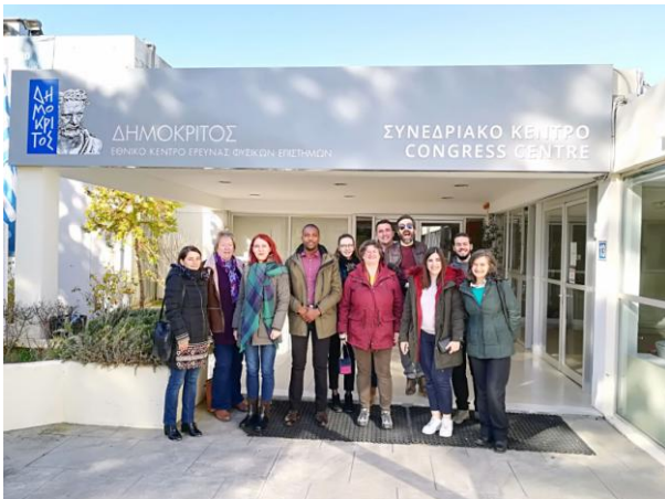
Partenerii la reuniunea de la Atena din ianuarie 2018

În ianuarie 2018, partenerii greci au găzduit a treia întâlnire transnațională a proiectului la Atena, în cadrul Centrului Național de Cercetare Demokritos. Accentul întâlnirii a fost acela de a monitoriza progresul proiectului și de a planifica pașii următori, pe măsură ce perioada de creare a modulelor de formare se apropia de final. Următoarea întâlnire a fost planificată, deoarece va coincide cu conferința finală.